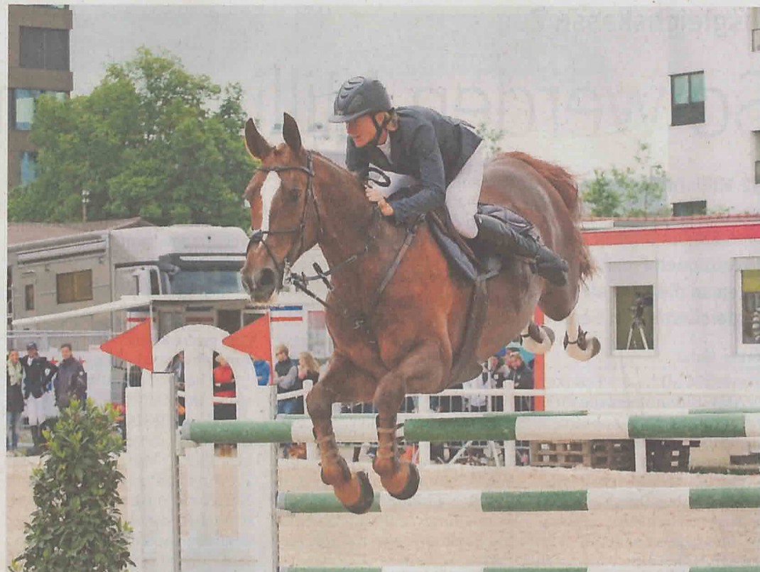
Am Pfingstmontag findet die Qualifikationsprüfung für die Schweizer Meisterschaften im Elite-Springreiten statt.