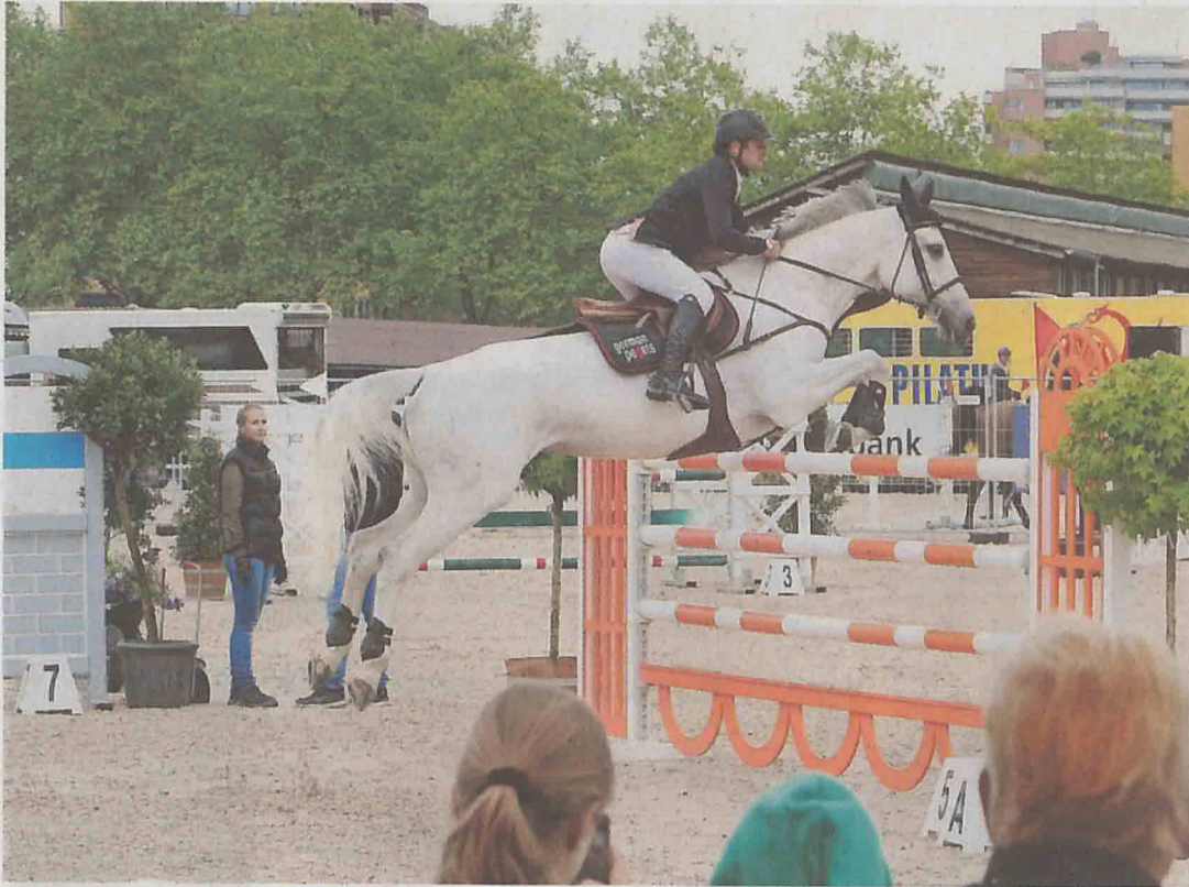
Die Hindernisse in den Prüfungen sind zwischen 90 und 155 Zentimeter hoch.